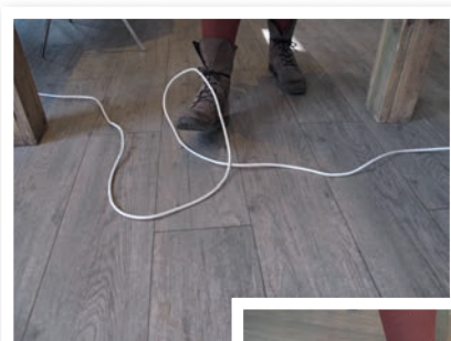
Unsicher: lose herumliegende Kabel

Auch im Hinblick auf Haftungsfragen ist es wichtig, einer sicheren Arbeitsumgebung genügend Aufmerksamkeit zu widmen. Als Repair-Café-Organisator(in) sollten Sie jederzeit nachweisen können, dass Sie alles Ihnen Mögliche unternommen haben, um eine sichere Umgebung zu schaffen. Versuchen Sie, die Fähigkeiten der Ehrenamtlichen in Ihrem Repair Café so gut wie möglich einzuschätzen, zum Beispiel dadurch, dass Sie neue Reparateure/-innen beim ersten Mal als Begleitung von jemandem einsetzen, der/die bereits länger erfolgreich in Ihrem Repair Café mitwirkt. Auch ist es wichtig, die Aufmerksamkeit nicht nur einmal sondern immer wieder auf die Sicherheitsanweisungen in diesem Dokument zu lenken. Senden Sie allen Ehrenamtlichen in Ihrem Repair Café dieses Dokument alle drei Monate per E-Mail oder teilen Sie alle paar Monate ausgedruckte Exemplare des Dokuments in Ihrem Repair Café aus. So bemühen Sie sich nachweisbar um Sicherheit.